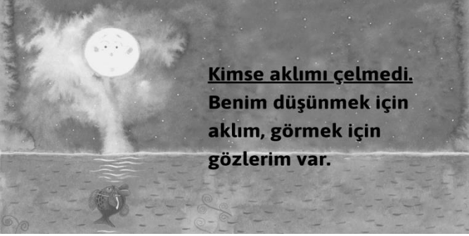
ALINTI – 1

5) Aşağıdaki soruları “Küçük Kara Balık” adlı esere ait alıntılardan yola çıkarak yanıtlayınız. (5 PUAN)